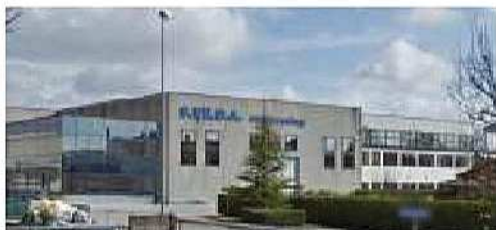
Edificio industriale a Silea (Tv)

Studio di compatibilità, invarianza idraulica e dimensionamento di un'area complessiva di circa 12.000 m 2 , facente parte di un Piano Integrato di Riqualficazione Urbanistica, Edilizia e Ambientale, in comune di Salgareda (Treviso), nell'area denominata "Ex Enopoli". Importo opere € 500.000,00. Periodo: anno 2009.