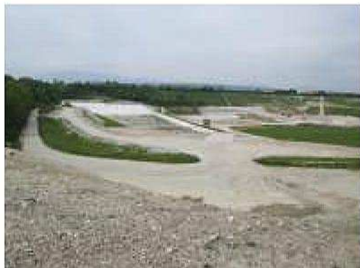
Ampliamento di discarica per rifiuti inerti in comune di Trevignano (TV)