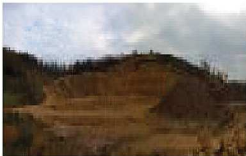
Miniera di argille caoliniche e smectitiche in comune di Sarego (Vi)

Verifica di assoggettabilità alla procedura di Valutazione di Impatto Ambientale ai sensi dell'art. 20 D. Lgs. 152/06 s.m.i. per il progetto di impianto di recupero rifiuti non pericolosi, ed in particolare rifiuti di fresato, ubicato in comune di Spresiano entro l'ambito di una cava. Periodo 2017. Istruttoria in corso presso la Provincia di Treviso.