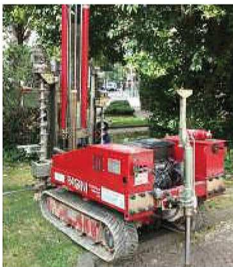
Esecuzione di prova penetrometrica statica presso cantiere a Treviso

Sede legale Via Siora Andriana del Vescovo, 7 31100 TREVISO