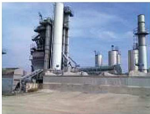
Impianto di recupero rifiuti non pericolosi in comune di Veduggio

Impianto per l'eliminazione ed il recupero dei rifiuti pericolosi e non pericolosi ubicato a Marghera in via dell'Elettronica, 5. Ex autorizzazione Integrata Ambientale: Decreto n. 30 del 29/05/2009 dalla Giunta della Regione del Veneto. Giudizio favorevole di compatibilità ambientale, approvazione del progetto e rilascio dell'Autorizzazione Integrata Ambientale (D.Lgs. n. 152/2006 e s.m.i., art. 23 della L.R. n. 10/99, D.G.R. n. 308 del 10/02/2009 e D.G.R. n. 327 del 17/02/2009: Deliberazione Della Giunta Regionale n. 448 del 10 aprile 2013.