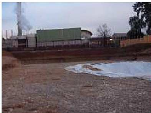
Intervento di bonifica presso Ospedale civile di Montebelluna (Tv)

Sede legale Via Siora Andriana del Vescovo, 7 31100 TREVISO