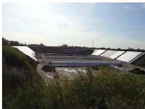
Recupero ambientale dell'ex cava Siberie mediante la progettazione definitiva per la costruzione e la gestione operativa e post-operativa di una discarica controllata in comune di Sommacampagna (Vr)

Sede legale Via Siora Andriana del Vescovo, 7 31100 TREVISO