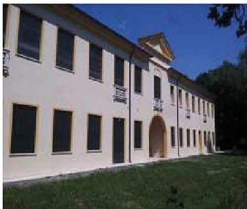
Ristrutturazione a Villorba (Tv) - Progetto e D.L. strutture -

Progettazione delle nuove reti per il convogliamento e la distribuzione delle acque meteoriche e delle acque nere del pastificio sito in comune di Rovato (Bs); redazione della S.C.I.A. (Segnalazione Certificata di Inizio Attività) per ammodernamento nuovi uffici, allargamento piazzale di scarico cisterne, demolizione del distributore carburante; Direzione dei Lavori generale; Coordinamento e sorveglianza ditte appaltatrici; Responsabile del coordinamento per la sicurezza in fase di progettazione ed esecuzione delle opere e Responsabile dei Lavori ai sensi della Legge 81/08. Periodo 2011.