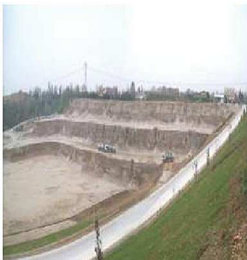
Discarica per rifiuti inerti in corrispondenza di cava di ghiaia in comune di Montebelluna (Tv)

Rinnovo della concessione della miniera Scalon in comune di Vas. Procedura di V.I.A. regionale con contestuale approvazione del progetto e autorizzazione ambientale. Periodo 2016. In istruttoria.