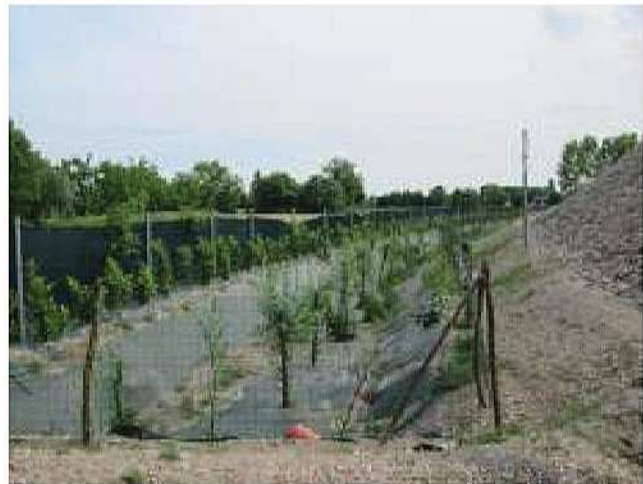
Impianto di fitoevapotraspirazione

Progetto di depurazione delle acque di scarico mediante la fito depurazione per Ditta Committente di Vazzola (TV): centro di autodemolizione di macchine militari.