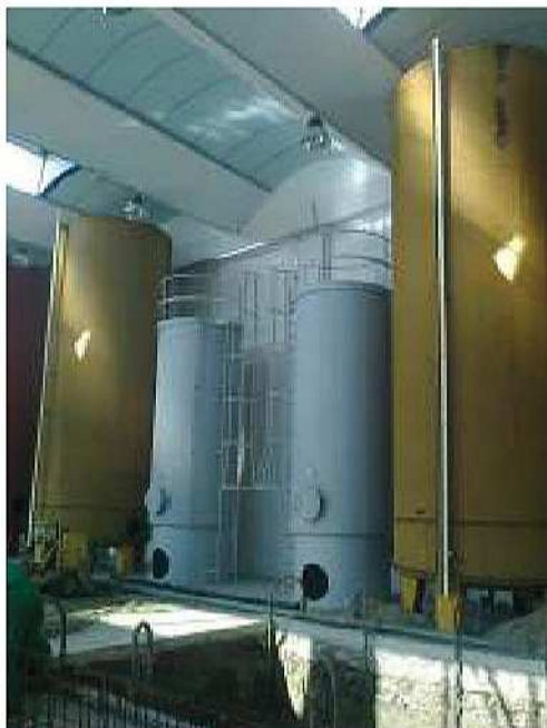
Impianto di recupero a Jesolo (Ve)

Progetto di demolizione di un fabbricato residenziale e ricostruzione di edificio ad uso commerciale e residenziale, sito a Paese (TV), in via Monte Pasubio. Progettista delle strutture e direttore dei lavori strutturali. Periodo 2013.