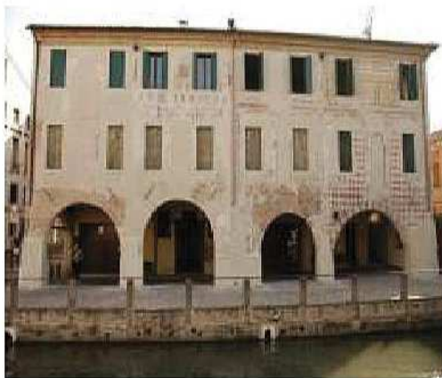
Ristrutturazione edificio residenziale

Sede legale Via Siora Andriana del Vescovo, 7 31100 TREVISO