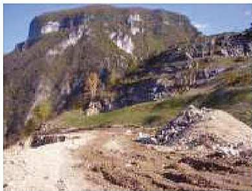
Miniera di sali magnesiaci a Vicenza

Studio di Impatto Ambientale inerente il progetto di coltivazione di una nuova cava di ghiaia denominata "Sofia 2" in comune di Loria. In corso di istruttoria. Periodo 2011.