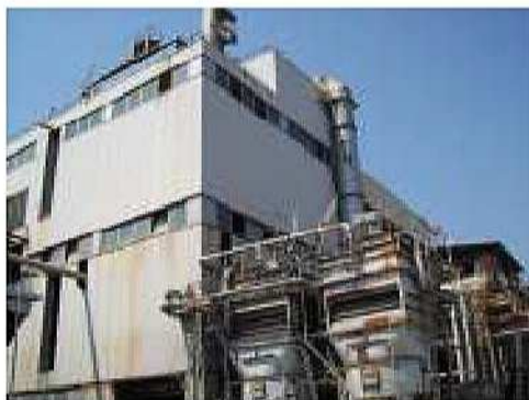
Impianto di conversione "Kaldo" per la produzione di rame raffinato

Realizzazione di nuovo impianto di inertizzazione e stabilizzazione rifiuti, anche pericolosi, nuovo impianto di frantumazione, nuovo impianto di vagliatura dei terreni. Importo opere 4.000.000 euro Periodo 2009-2013