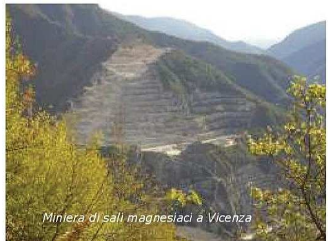
Miniera di sali magnesiaci a Vicenza