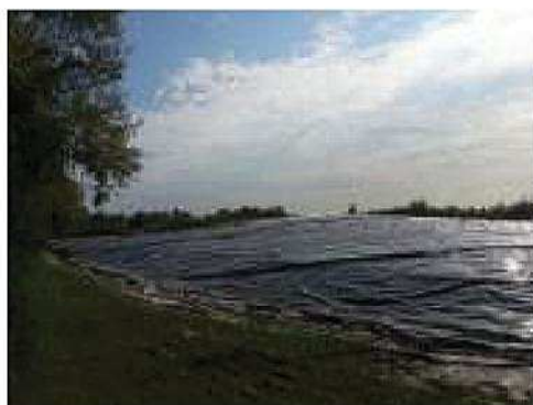
Discarica per rifiuti non pericolosi in comune di Silea (Tv)