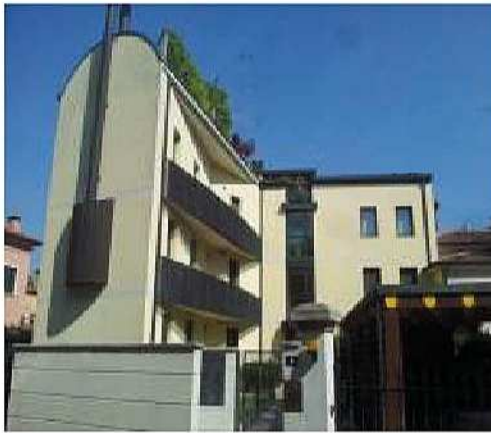
Edificio residenziale a Treviso - Progetto e D.L. strutture -

Sede legale Via Siora Andriana del Vescovo, 7 31100 TREVISO