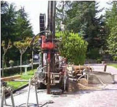
Esecuzione di sondaggio a carotaggio continuo alla profondità di 10 m presso cantiere a Tarzo (Tv)