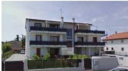
Edificio residenziale a S. Donà di Piave (Ve)

Assistenza di cantiere e direzione dei lavori presso la Caserma Camp Darby - Sea Pine Lodge - a Livorno.