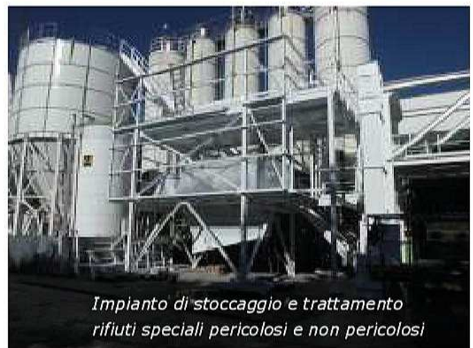
Impianto di stoccaggio e trattamento rifiuti speciali pericolosi e non pericolosi