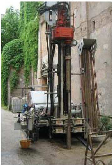
Esecuzione di sondaggi a carotaggio continuo, con corona diamantata, diametro di perforazione pari a 125 mm presso cantiere a Treviso

Progetto di restauro ed adeguamento funzionale del Fontego Dei Tedeschi a Venezia. Lo studio è stato impostato sulla base delle indicazioni riportate al capitolo 6 delle "Norme tecniche per le costruzioni" approvate con D.M. del 14 gennaio 2008 e della Circolare 2 febbraio 2009 nr. 617 "istruzioni per l'applicazione delle NCT". Esecuzione della seguente campagna d'indagini geotecniche che definisce il modello geologico e geotecnico del sito: nr. 2 sondaggi geognostici a carotaggio continuo spinti fino alla profondità di 30 m con esecuzione, in corrispondenza dei principali livelli sabbiosi, dei Standard Penetration Test (SPT). Prelievo di 2 campioni indisturbati per sondaggio con esecuzione di prove di laboratorio per la caratterizzazione completa dei livelli argillosi. Redazione di elaborato di contenuto geologico tecnico, completo di allegati grafici e documentazione fotografica.