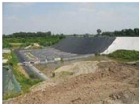
Discarica per rifiuti non pericolosi in comune di Loria (Tv)

Sede legale Via Siora Andriana del Vescovo, 7 31100 TREVISO