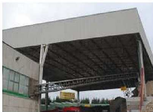
Edificio carpenteria metallica a Noale (Ve)

Progettazione architettonica, strutturale, coordinamento per la sicurezza e direzione dei lavori di ristrutturazione di edificio residenziale a Treviso in via Rigamonti. Importo opere Euro 280.000,00 Periodo 2002.