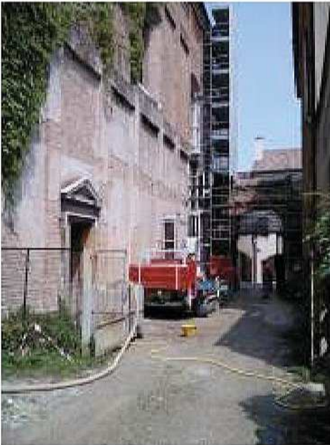
Esecuzione di sondaggio a carotaggio continuo alla profondità di 10 m presso cantiere a Treviso

Indagine geologica e ambientale ai sensi della DGRV 2424/2008, volta alla valutazione delle caratteristiche dell'area destinata alla ristrutturazione di due ali - di via Boiago e di via Noalese - dell'Istituto Menegazzi sito in comune di Treviso, loc. San Giuseppe.