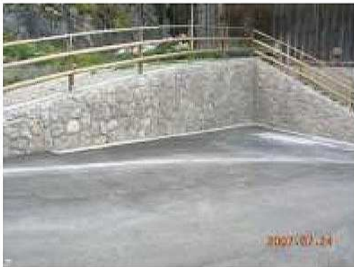
Lavori di sistemazione del centro storico del comune di Livinallongo del Col di Lana (BI)

Sede legale Via Siora Andriana del Vescovo, 7 31100 TREVISO