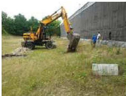
Bonifica e messa in sicurezza di una ex cava in provincia di Verona: campagna d'indagine del fondo

Indagine ambientale per la dismissione dell'impianto di conceria e trasformazione ad area residenziale. Periodo 2004.