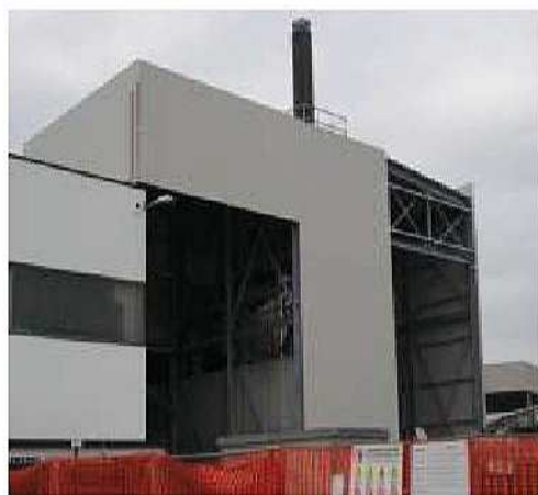
Edificio industriale in provincia di Venezia

Sede legale Via Siora Andriana del Vescovo, 7 31100 TREVISO