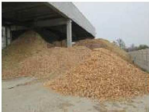
Impianto di recupero a Noale (Ve)

Domanda di autorizzazione unica per impianto di gestione dei rifiuti ai sensi art. 208 D.Lgs. 152/06—operazioni R13-R2, in comune di Zerman—Mogliano Veneto (Tv). Periodo 2017. Progettazione in corso.